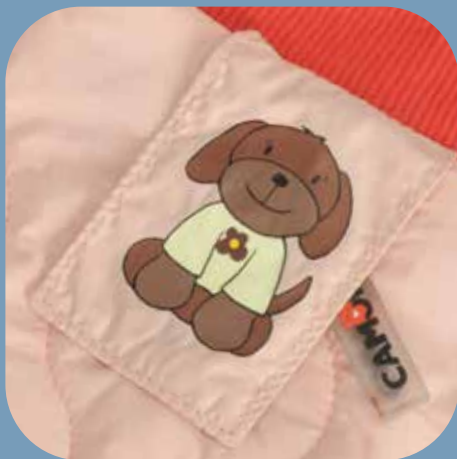
BORSA MIA CA657 Misure 37x17x26 cm Per cani fino a 5 kg